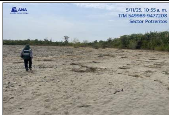
VISTA DESDE AGUAS ARRIBA DE LA INTERVENCIÓN