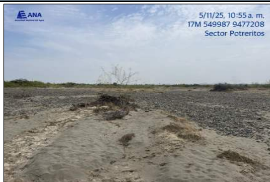
VISTA DESDE AGUA DEBAJO DE LA INTERVENCIÓN